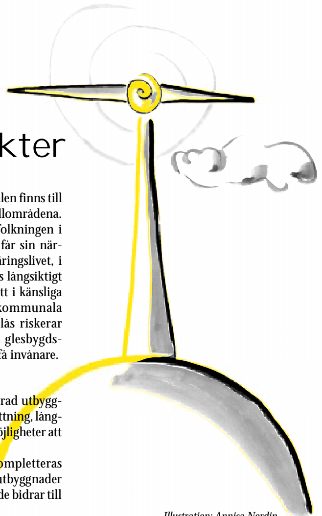
Illustration: Annica Nordin

Utredningen bör därför kompletteras med förslag till hur vindkraftsutbyggnader kan planeras och stödjas så att de bidrar till en positiv regional utveckling.