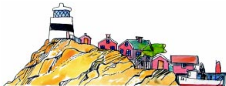
ILLUSTRATION: HANS AREN

En annan slutsats i rapporten är att universitet och högskolor är viktiga för länenas företagande. I Jönköping har man väl etablerade samarbetsformer kring både teknisk utveckling och företagsledning. Högskolan är inte på samma sätt förankrad i Jämtland, förmodligen därför att den inte har matchat näringslivets behov tillräckligt.