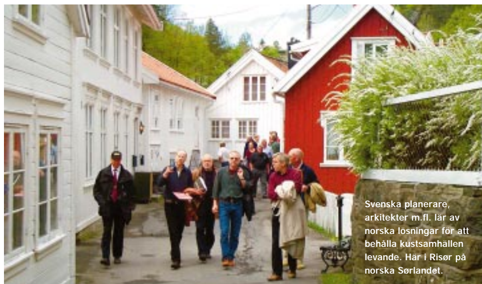
Svenska planerare, arkitekter m.fl. lär av norska lösningar för att behålla kustsamhällen levande. Här i Risør på norska Sørlandet.

Glesbygdsverket har nu föreslagit att den kommande utredningen om Plan- och bygglagen ska få i uppdrag att utreda en möjlighet för kommuner att införa planbestämmelser så att en bostads användning för permanent- eller fritidsboende kan regleras i en detaljplan.