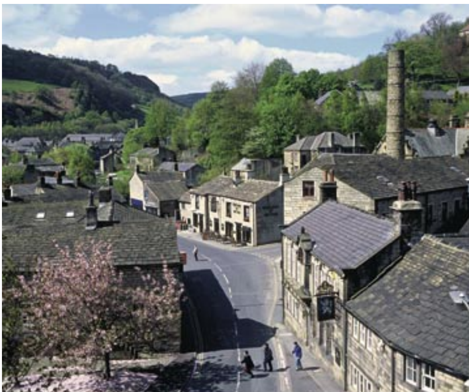
Hebden Bridge, West Yorkshire.

Arrangörer är SCB, Svenska Kommunförbundet, Glesbygdsverket, Arena för Tillväxt och Svensk Demografisk Förening. Inbjudan med program skickas ut inom kort och kommer att finnas tillgänglig på arrangörernas hemsidor.