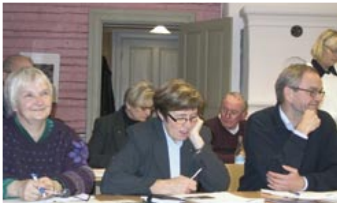
Arbetssättet i trepartnerskap skapar en kreativ och dynamisk miljö. Här är det LAG-gruppen i Sommenbygd som sammanträder.

När Leader+ nu har utvärderats efter halva programtiden konstaterar utvärderarna att arbetet i trepartnerskap skapar en kreativ och dynamisk miljö. Att de tre parterna har lika stark röst har bidragit till att utjämna gamla maktpositioner. Den kun-