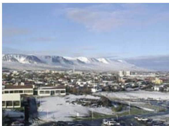
Akureyri på norra Island var platsen för en konferens om hur företag utanför storstäder kan stärkas.

Hur kan man stärka innovationsförmågan hos företag utanför storstadsmiljöer och högteknologisektorer? Den frågan diskuterade forskare och experter under ett par dagar i oktober. Utgångspunkt för diskussionen var fem undersökningar i de nordiska länderna. Undersökningarna bygger på intervjuer med innovativa företagare och representanter från olika organisationer och myndigheter ansvariga för näringslivsutveckling.