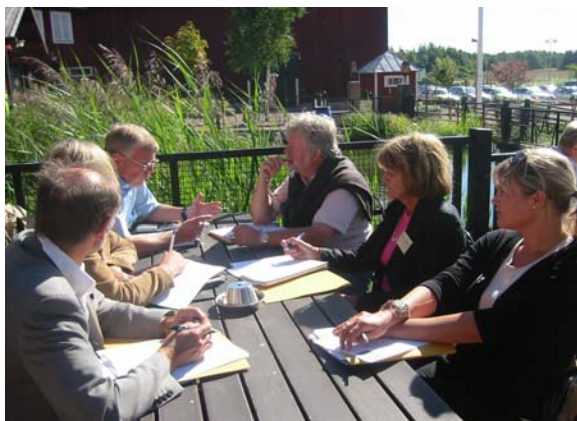
Mingel och diskussioner i Jönköping respektive Västerås.