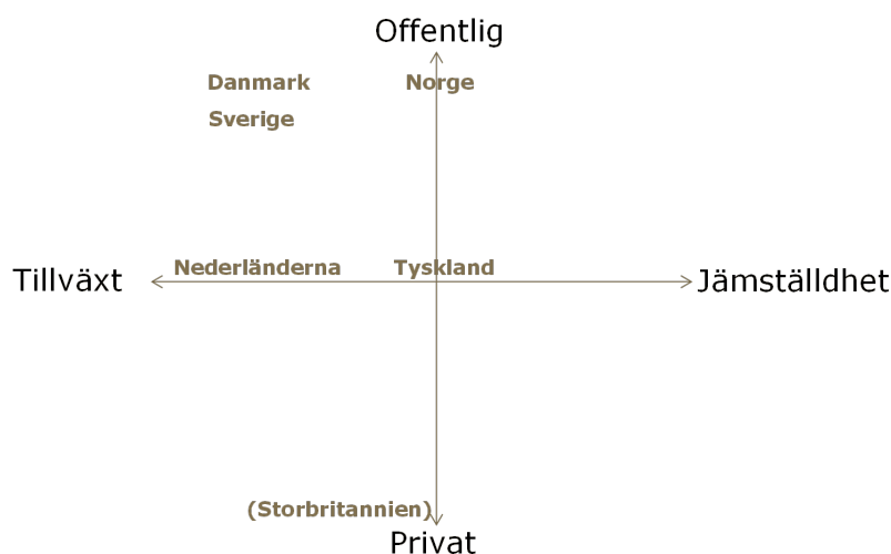
Figur 2 Ländernas insatser i relation till tillväxt/jämställdhet och offentligt/privat