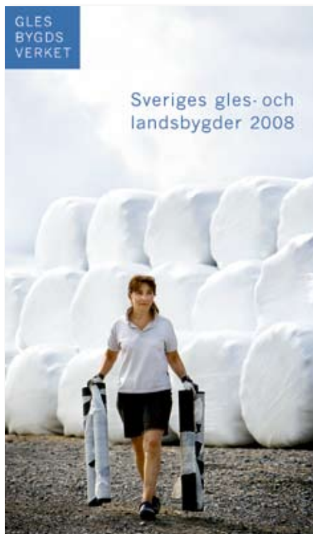
Årsboken kan beställas eller laddas ned på www.glesbygdsverket.se

– Det framkommer att invandrare födda i ett "gammalt" EU-land som Tyskland och Nederländerna i större utsträckning står för det som kan betecknas som "livsstilsinvandring", medan invandrare från "nya" EU-länder som Polen står för en arbetsmarknadsrelaterad invandring,