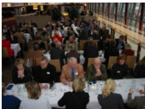
Lunch på PrimePoint Arlanda.