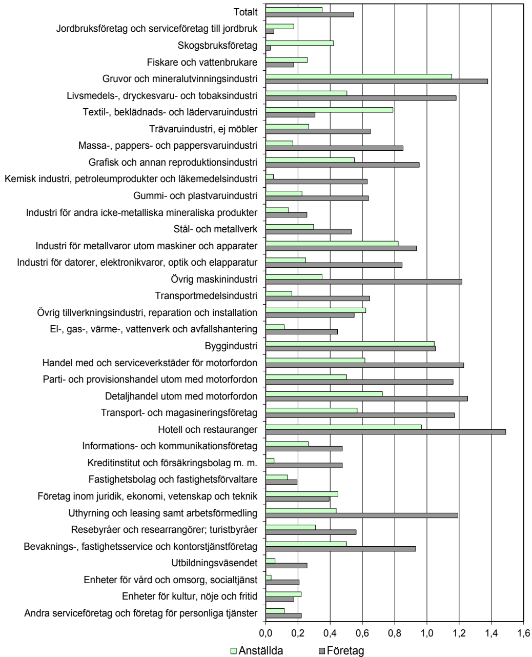
Figur 2 Antal företagskonkurser och anställda berörda av konkurs i förhållande till företagsstocken respektive det totala antalet anställda 2015 efter bransch, i procent